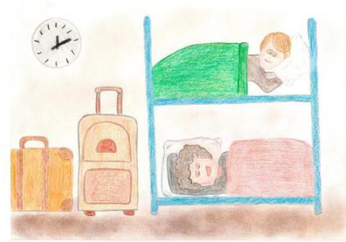
Berivan C. "Klassenfahrt"