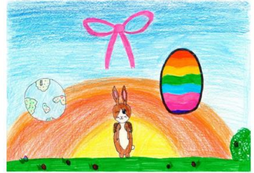
Chantal Z. "Bunte Ostern"