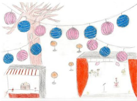
Milena L. "Lichterfest" November 2020