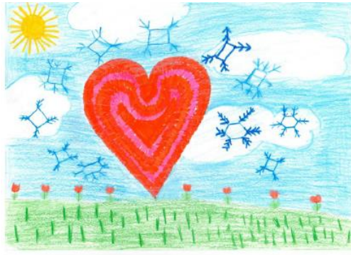
Nimra N. "Der schöne Februar"